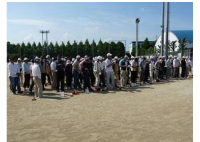
参加いただいた方々