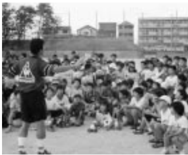
少年サッカー教室

7/6(土)に松下電器産業(株)半導体社構内にて「Waveフェスタin長岡京」が開催されました。当日は、ガンバ大阪Jr コーチによる少年サッカー教室、シュートガン体験コーナーや、模擬店、長岡京市の新鮮野菜即売会、乙訓福祉施設の手作り授産品即売会、お楽しみ抽選会などたくさんの方々に来ていただき本当にありがとうございました。これからもこのようなイベントを継続していく予定です。今回来られなかった方は、ぜひ次回にお越しください。