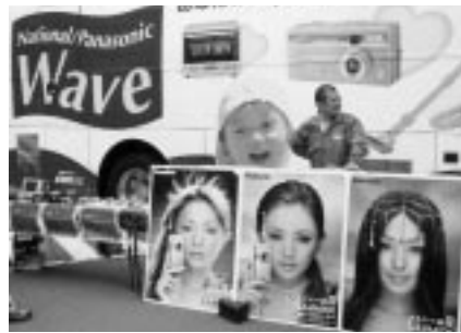
全国キャラバン・パス Wave号