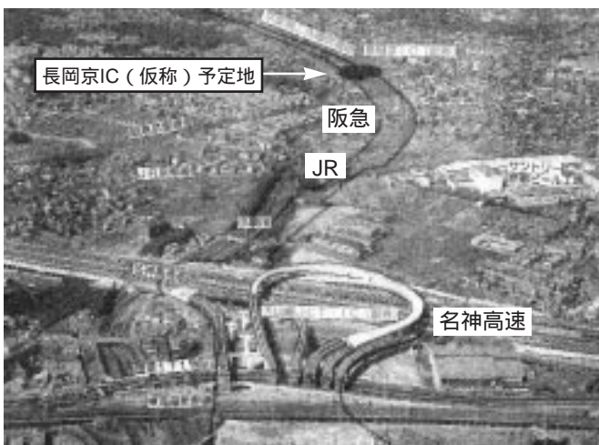
大山崎JCT・IC(仮称)から長岡京市域を望む

道路にかかる地域に住まれている方々の買取要望に基づき、事業用地の先行取得については、平成十三年度末現在、市の試算で全体の約四十一%となっています。今年度も国土交通省においては用地取得の予算を確保し、業務を代行する京都府土地開発公社が予算の範囲内で、買取を要望される方との交渉にあたる予定です。しかし、このB区間の全体スケジュールは依然明確ではありません。環境悪化への対策をどうするのかなど、今後の事業進捗ごとに市民への分かりやすい情報提供を求めていきます。京都第二外環状道路についてのご意見・ご質問をお待ちしております。