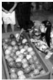
子どもに人気のヨーヨーつり