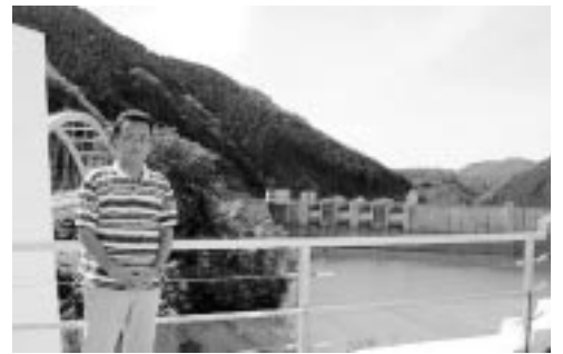
京都府営水の源 日吉ダムのビジターセンターから

収益的収支では一・六億円の赤字決算となり、利益積立金、建設改良積立金を取り崩して補填されます。資本的収支では一・六億円の赤字決算となり、利益積立金、建設改良積立金を取り崩して補填されます。