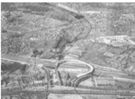
大山崎JCT・IQ(仮称)(後援会ニュース第4号より)

後援会ニュース第4号で京都第二外環状道路 A区間(京滋バイパス～名神高速道路まで)の開通時期について、今年の3月とお伝えしていましたが、一部工事と土地買収の遅れにより秋頃の開通に延期されます。