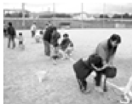
ペットボトルロケット飛ばしゲーム

後援会ニュース第五号にてご案内しました「親子であそぼう創作ひろば」を、昨年の十一月二日に松下電器半導体社にて開催しました。 当日はたくさんのご家族にお越しいただきまして、ありがとうございました。 写真のコーナーの他にペットボトル工作のコーナーや福祉施設産品の販売、長岡京市の野菜市など、親子で楽しんでいただけましたでしょうか。ご来場いただいた方より、