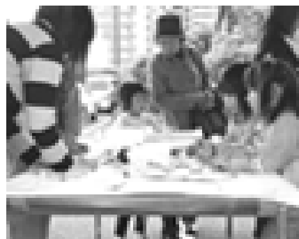
メッセージカード作りコーナー