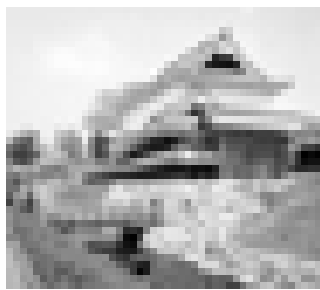
勝龍寺城公園 (市のHPより)

また、市内神足二丁目の旧西国街道にある国登録有形文化財の「石田家住宅」を購入する(土地・家屋とも)歳出予算も認められました。