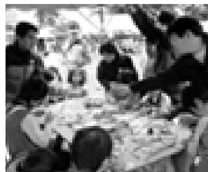
クラフトコーナー