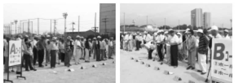
第2回「グラウンドゴルフ大会」から

お問い合わせと出場ご希望の方は、長岡京市民懇話会(担当/大谷・大西)までお電話ください(TEL: 956-9597)