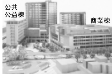
JR長岡京駅西口再開発施設完成予想模型

総合交流センターには、市民交流フロア、市民活動サポートセンター、オープンラウンジ、観光情報センター、総合生活支援センター、中央学習センター、教育支援センター、女性交流支援