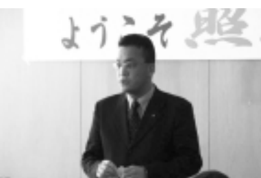
地域フォーラム(松下照明工場見学会)