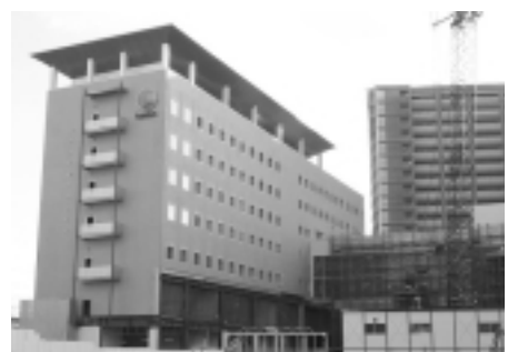
建設が進むバンビオ一番館(公共公益棟)

JR長岡京駅西口に四月オー プンする予定のバンビオ一番館 (公共公益棟)に開設される、市 民フロアと中央生涯学習センタ ー、総合生活支援センターなど 計七施設とバンビオ二番館(商 業棟)に開設される長岡京市営 長岡京駅西駐車場にそれぞれ指 定管理者を指定する条例です。