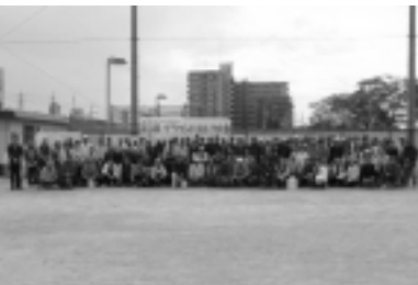
参加いただいた皆さま

次回以降の開催案内は、この後援会ニュースや「進藤ひろゆきホームページ」に掲載いたします。