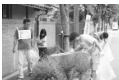
連合乙訓列島クリーンキャンペーン