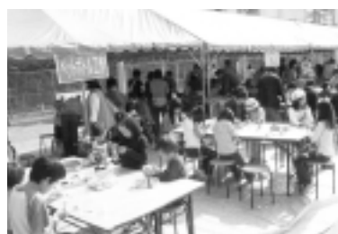
ペットボトル工作