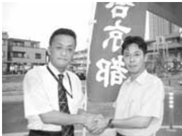
中小路健吾 京都府議会議員