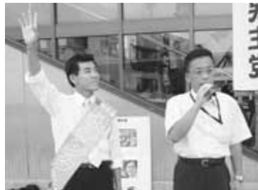
泉ケンタ 衆議院議員