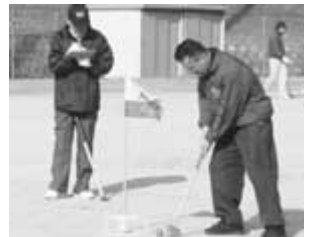
第5回大会では私もプレーしました

日 時：5/13(土)雨天のときは5/20(土) 9:00~12:00 場 所：松下電器産業(株)半導体社 グラウンド 参加費：お一人様300円