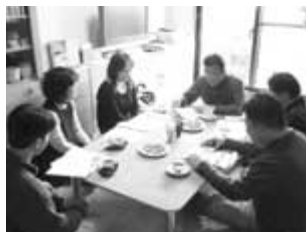
第1回 進ちゃんFORUMより

第2回 進ちゃんFORUM 日時：7/9(日)14:00~ 場所：「進藤ひろゆき」自宅