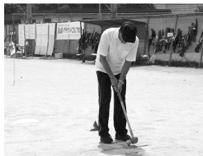
私もプレーしました