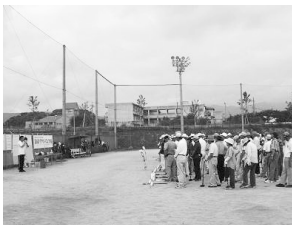
参加いただいた皆さま