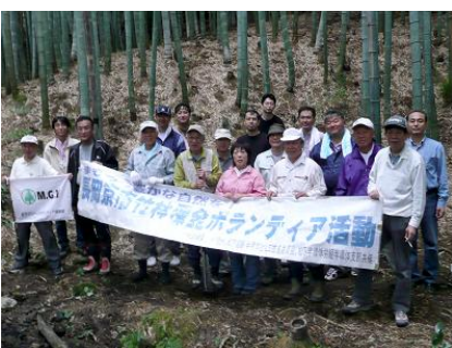
参加いただいた方々