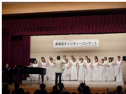
コンサートの模様

会場で行わせていただいたユニセフへのチャリティー募金は、総額で116,300円でした。募金にご協力いただいた皆さま、また、当日の準備などご協力いただいた皆さま、本当にありがとうございました。