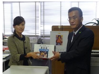
ユニセフへ寄付いたしました