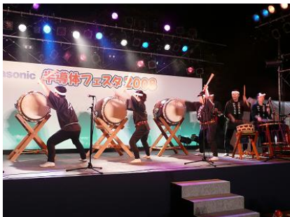
「北開田響太鼓」の皆さん