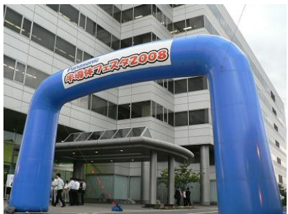
正門の入場アーチ