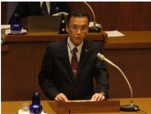
質問と答弁の概要です(長岡京市のホームページに議事録が掲載されています)。