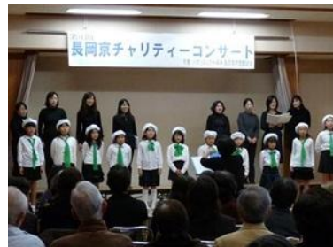
長岡京市少年少女合唱団の皆さま