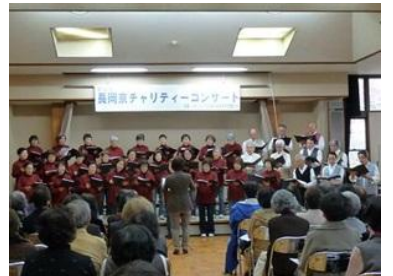
コーロ・ルッコラの皆さま

募金にご協力いただいた皆さま、また、当日の準備などご協力いただいた皆さま、本当にありがとうございました。