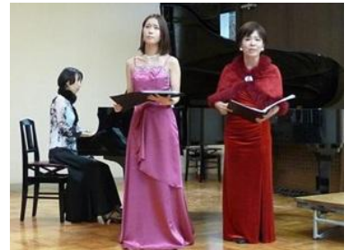
ソプラノソロとピアノソロ