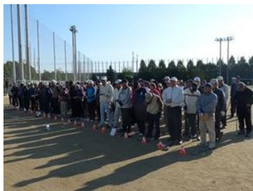
参加いただいた方々