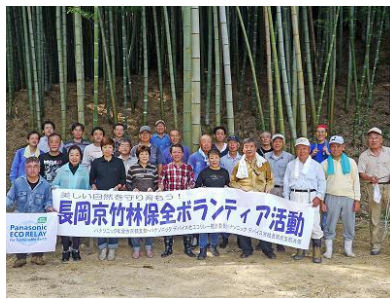
参加いただいた方々