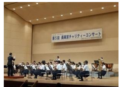
西乙訓高等学校吹奏楽部の皆さま