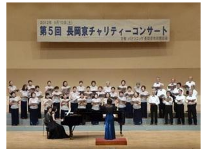
コーロ・ルッコラの皆さま

募金にご協力いただいた皆さま、また、当日の準備などご協力いただいた皆さま、本当にありがとうございました。