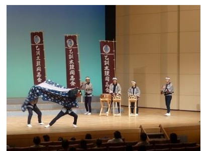
乙訓太鼓同志会 怒涛の皆さま