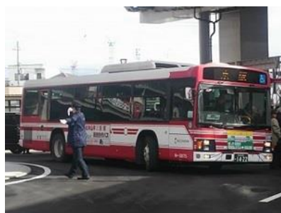
新規バス路線 90 系統