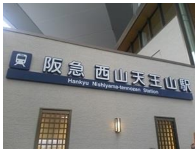
阪急西山天王山駅東口

セレモニー後は開業記念列車に乗り、西山天王山駅から桂駅までを往復乗車しました。道中の途中駅では鉄道ファンの皆さんがホームから記念列車の写真を撮っていました。