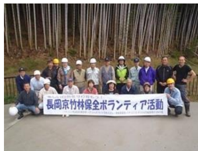
第31回 参加いただいた方々

昨年の10/19(土)に第31回目、12/14(土)に第32回目となる「西山森林整備竹林ボランティア活動」を、各団体のご協力のもと奥海印寺鈴谷の近くで実施しました。10月は台風通過後の現地周辺整備と清掃、12月は毎年1月17日に神戸市で行われている「阪神淡路大震災1.17のつどい」に使われる"竹灯籠(とうろう)"用の竹作成を行いました。