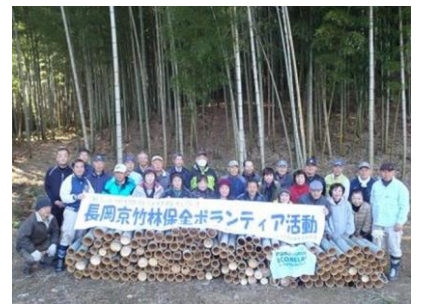
第32回 参加いただいた方々

この竹林保全ボランティア活動は、私の環境政策「自然と共生できるくらし文化の創造」の実現へ向けての活動のひとつとして、これからも積極的に推進してまいります。