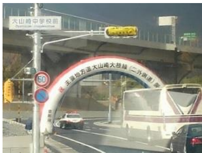
府道大山崎大枝線通り初め

昨年の12/21(土)に「阪急西山天王山駅」が開業しました。そして、国道171号線から調子八角交差点までを結ぶ府道大山崎大枝線も同日開通し、中央公民館では「阪急西山天王山駅開業・駅前広場完成及び府道大山崎大枝線開通記念式典」が開催されました。引き続き府道大山崎大枝線の通り初めの後、阪急西山天王山駅東口駅前広場で行われたセレモニーに出席しました。