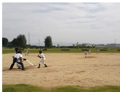
優勝・準優勝チームによる模範試合