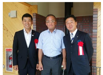
泉衆議院議員・福山参議院議員と