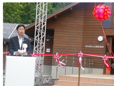
中小路市長の挨拶

この管理棟の学習室や展示室は、環境学習を目的とした使用については、使用料が全額免除されます(公園行為許可申請書の提出が必要です)。皆さんに愛される公園として末永く活用されることを望むところです。