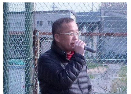
司会進行を務めました