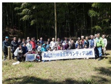
参加いただいた皆さま

この日は、この時期に恒例の「タケノコ掘り」を中心とした活動を行いました。今年是不作の年となり、参加いただいた皆さまには残念な状況となりましたが、タケノコ掘りを楽しんでいただくことができました。参加された皆さま、ありがとうございました。