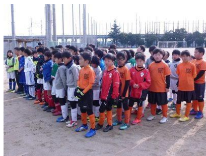
参加選手の皆さん

優勝されたチームの皆さん、おめでとうございます!また、サッカーチーム関係者の皆さまには、早朝から大会準備と運営にご協力いただきありがとうございました。