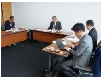
長門市議会研修風景