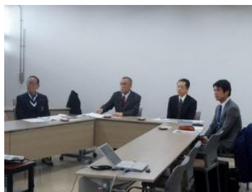
山陽小野田市議会研修風景

今回の研修視察で学んだことを長岡京市議会の議会改革、長岡京市の情報発信力強化へ向け、活かしてまいります。