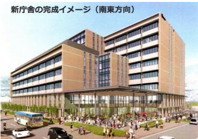
※イメージであり、確定したものではありません。