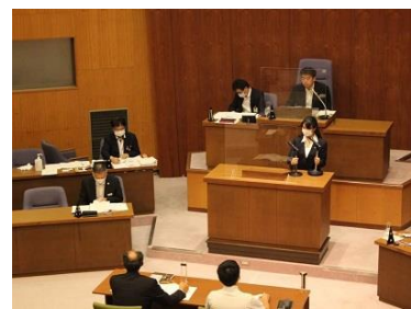
一般質問時の議場の様子

【議場での感染対策】 今議会での一般質問も、こまめな換気を行うとともに、議員と答弁者の席配置や、発言席へのアクリル板設置、発言者が変わることに消毒済みのマイクに取り換えるなどの工夫を行いました。