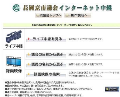
インターネット中継ページ(リニューアル前)