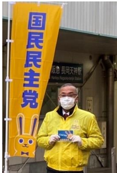
阪急長岡天神駅西口