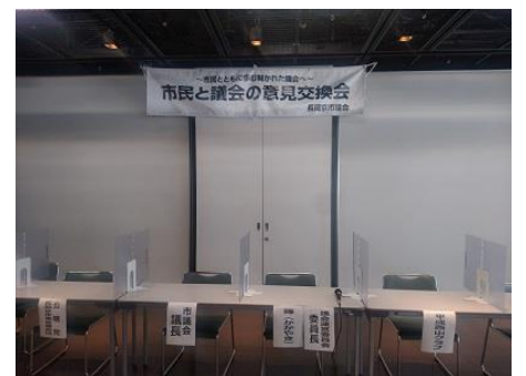
<バンビオ1番館市民ギャラリー>

皆さまからの貴重なご意見、ご要望を真摯に受け止め、今後の議会運営に活かしていきたいと考えます。