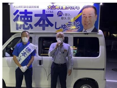
<マイク納めの司会>