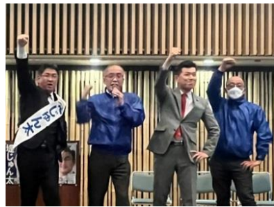
私からのがんばるぞー三唱

また、さらに便利で安全なまちを目指し、阪急長岡天神駅周辺の整備検討を進めるとともに、JR長岡京駅東口広場整備や（仮称）介護予防センターの建設着手、都市公園や社会教育施設などの公共施設の長寿命化、西国街道再整備や八条ヶ池ふれあい回遊のみち舗装整備など、長岡京らしい都市環境の整備を進め、まちの新陳代謝を加速する予算も計上されました。